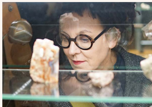
Warsaw Galley Weekend 2022: Lapis Mudni. Nicolas Grosperre.

wystawa w 80 rocznicę Powstania Warszawskiego