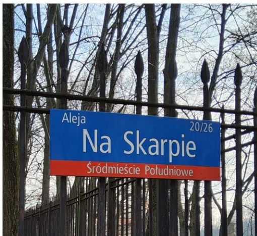
PAN Muzeum Ziemi