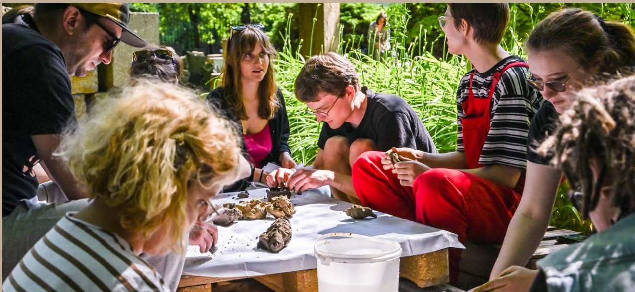
Pępek Ziemi z WBASK Akademii Sztuki Pięknych, 4.06.2023