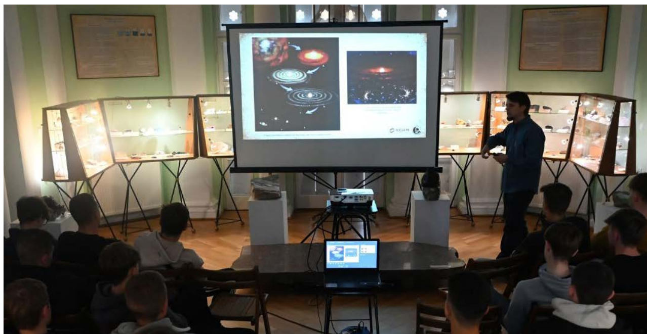
Podróże z Domeyką. Warsztaty dla KGHM Polska Miedź

PAN Muzeum Ziemi z Instytutem Gospodarki Surowcami Mineralnymi i Energią PAN szkolenie dla nauczycieli