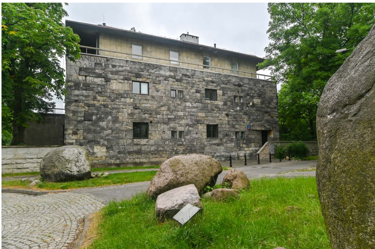
PAN Muzeum Ziemi, willa Pniewskiego

Cykl audycji i spotkań inspirowanych domem własnym Bohdana Pniewskiego, przybliżających projekty, realizacje i wykorzystanie domów własnych architektów na całym świecie.