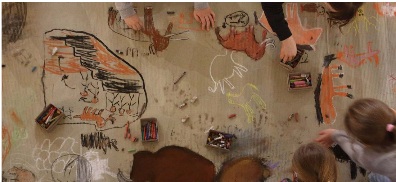
Ferie w PAN Muzeum Ziemi 2023.